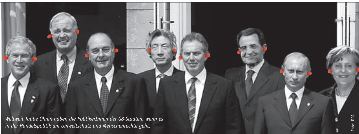
Weltweit Taube Ohren haben die PolitikerInnen der G8-Staaten, wenn es in der Handelspolitik um Umweltschutz und Menschenrechte geht.

Das erste Aktionswochenende findet vom 13.-15. Oktober statt. Das Team von Gerechtigkeit jetzt! unterstützt Sie gerne: Mit Tipps, wer vor Ort schon aktiv ist, mit Ideen für Aktionen und mit Beratung für die Pressearbeit: 0228 – 368 10 10.